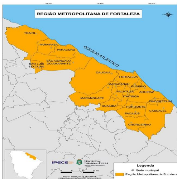
Figura 1 - Região de influência da Faculdade Católica de Fortaleza.

A figura a seguir retrata graficamente a área de influência da Instituição.